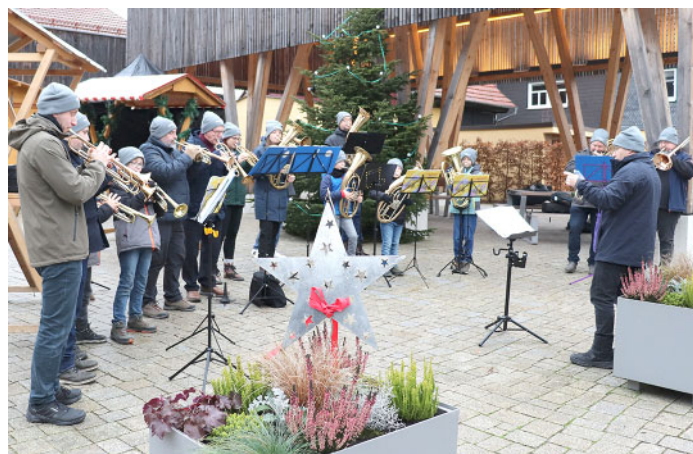
Der Posaunenchor eröffnete sein Kurrendeblasen in der Neuen Mitte Mitwitz