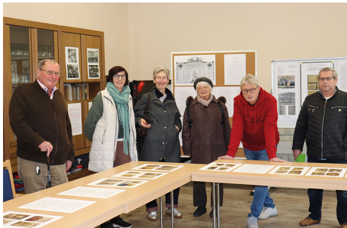
Volkstrauertag (Ausstellung): Reges Interesse zeigen die Besucher an der Ausstellung „Erster Weltkrieg - Spurensuche in Mitwitz“

cooperate-media Werbeagentur Mitwitz www.cooperate-media.de